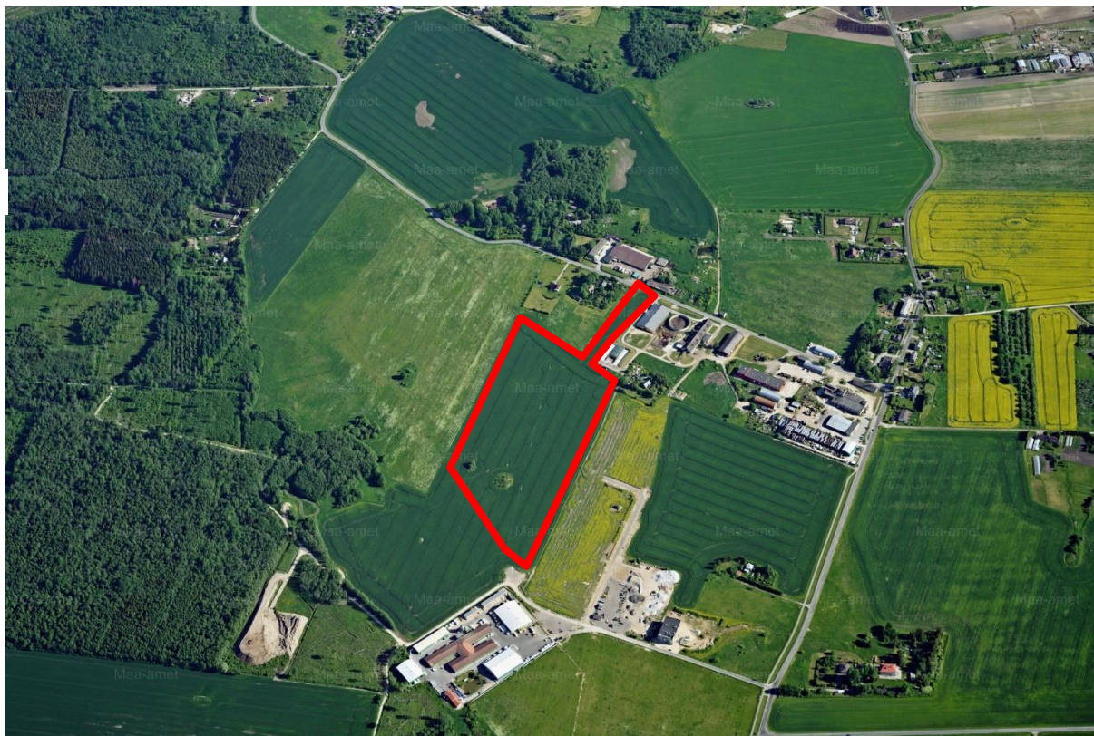
Maa-amet kaldaerofoto 11.06.2022